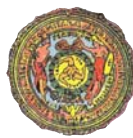
Università degli Studi di Palermo